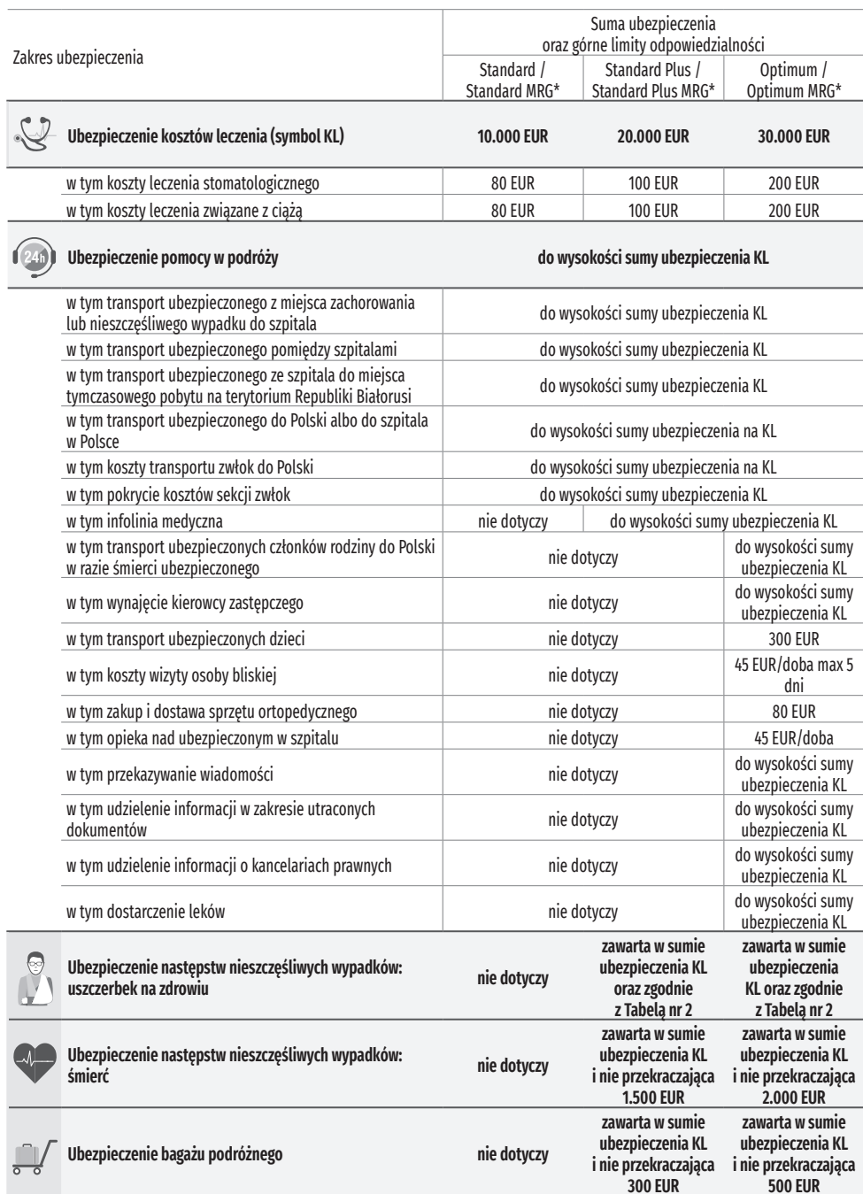
➤ Tabela nr 1